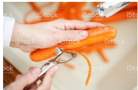
Abbildung 3 und 4: Gründliches Waschen und Schälen sind wichtig um Schadstoffe aus dem Boden von den Pflanzen zu entfernen