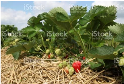
Abbildung 2: Stroheinstreu bei Erdbeeren

Bei Erdbeeren sollte eine zusätzliche Sicherung durch eine Stroheinstreu oder ähnlichem von der Blüte bis zur Ernte der Früchte erfolgen. Diese verhindert sowohl die Bodenanhaftung als auch die Entstehung von Fäule.