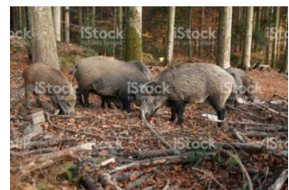
Abbildung 6, 7 und 8: Erzeugnisse aus Wald und Wiesen können Schwermetalle besonders stark angereicht haben