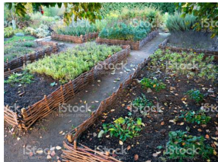
Abbildung 5: Beispiel für Hochbeete

Bei hohen Nährstoffvorräten in Gartenböden ist jede überflüssige Düngung zu vermeiden. Denn Dünger kann Schwermetalle in Lösung bringen und selbst Schadstoffe enthalten. Eine Kompostierung von Gartenabfällen wie z.B. Rasenschnitt ist weiterhin möglich, da hierdurch keine weitere Anreicherung der Schwermetalle im Boden erfolgt.