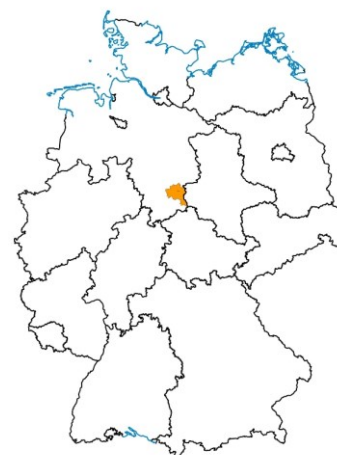
Lage im Land Niedersachsen